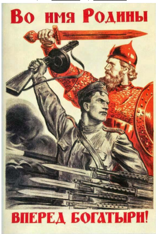
Плакат «Во имя Родины вперед, богатыри!» 1943 г.

6. Образ на втором плане советского плаката «Во имя Родины вперёд, богатыри!» узнаваем. Как вы считаете, какой смысл хотел передать художник, используя этот образ во время Великой Отечественной войны?