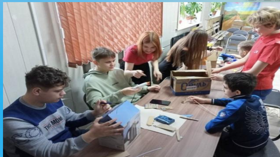
Трудовой десант «Чистый двор»