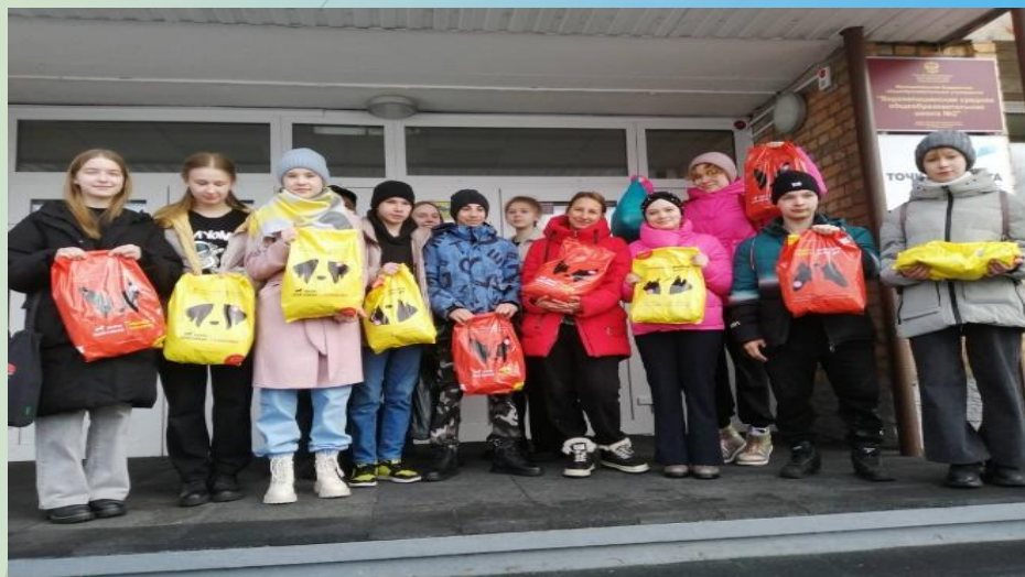
Оказание благотворительной помощи животным приюта «Неравнодушный Енисейск»